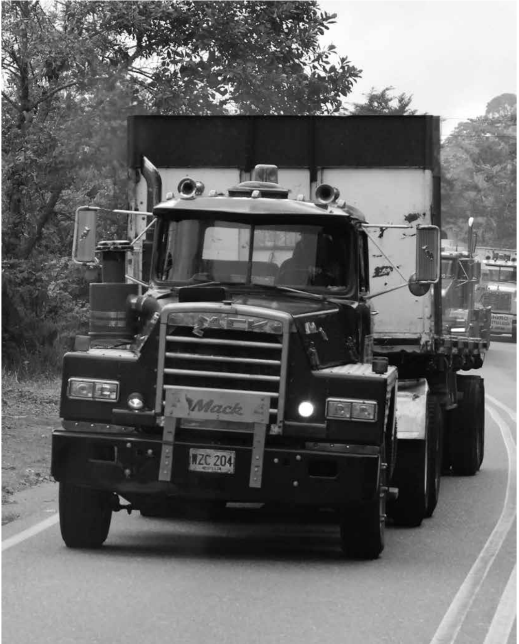
Otros nómadas. Villeta - Bogotá Leonardo Montenegro