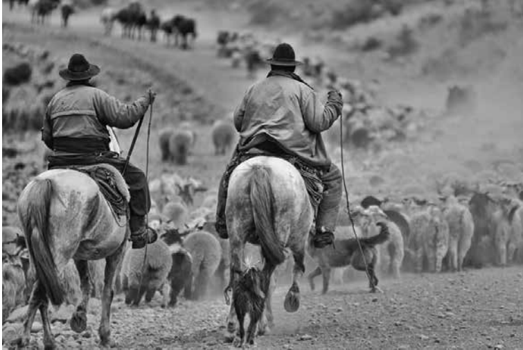
Figura 2: puesteros en movimiento.

El reverso de la enajenación de la tierra es el desalojo, por eso es que la precariedad del uso ancestral de cara a la privatización de la tierra, solo es posible en la medida en que la productividad del Estado cede a esos abusos.