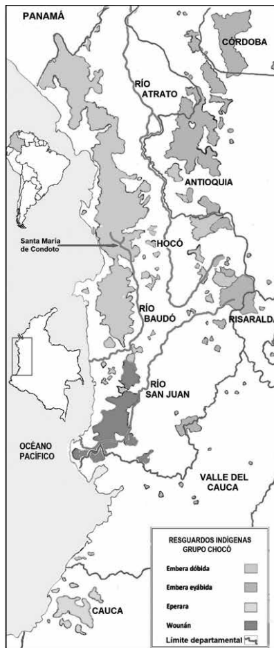
Mapa 1. Resguardos indígenas grupo chocó. Elaboración del autor a partir de: https://igac.gov.co/sites/noticias.igac.gov.co/files/wp-content/uploads/2015/09/RESGUARDOS_INDIGENAS_EMBERA.pdf

A finales de los años 1980 surgió la Organización Regional Embera Wounaan en el Chocó, la cual impulsó la creación de poblados y logró por parte del gobierno la titulación de la totalidad de los territorios indígenas bajo la forma de resguardos los cuales son gobernados por los cabildos, unas juntas elegidas anualmente por la población indígena. Cabildos y resguardos son reconocidos por la Constitución colombiana (Flórez López, 2007, pp.104-113; 333-394).