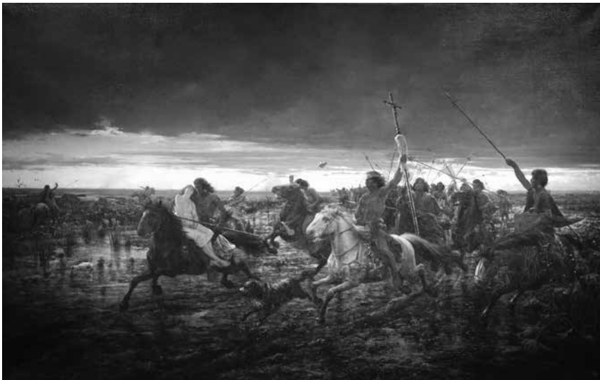
Figura 3: La vuelta del malón. Pintura al óleo del pintor argentino Ángel Della Valle, realizada en el año 1892 ( https://www.bellasartes.gov.ar/coleccion/obra/6297/ )

indios aparecen, así, imbuidos de una connotación impía y demoníaca. El cielo ocupa más de la mitad de la composición, dividida por una línea de horizonte apenas interrumpida por las cabezas de los guerreros y sus lanzas. En la oscuridad de ese cielo se destaca luminosa la cruz que lleva uno de ellos y la larga lanza que empuña otro, como símbolos contrapuestos de civilización y barbarie. En la montura de dos de los jinetes se ven cabezas cortadas, en alusión a la crueldad del malón. En el extremo izquierdo se destaca del grupo un jinete que lleva una cautiva blanca semidesvanecida, apoyada sobre el hombro del raptor que se inclina sobre ella. Fue este el fragmento más comentado de la obra, a veces en tono de broma, aludiendo a su connotación erótica, o bien criticando cierta inadecuación del aspecto (demasiado «civilizado» y urbano) de la mujer y de su pose con el resto de la composición. (Malosetti, s/d) 9