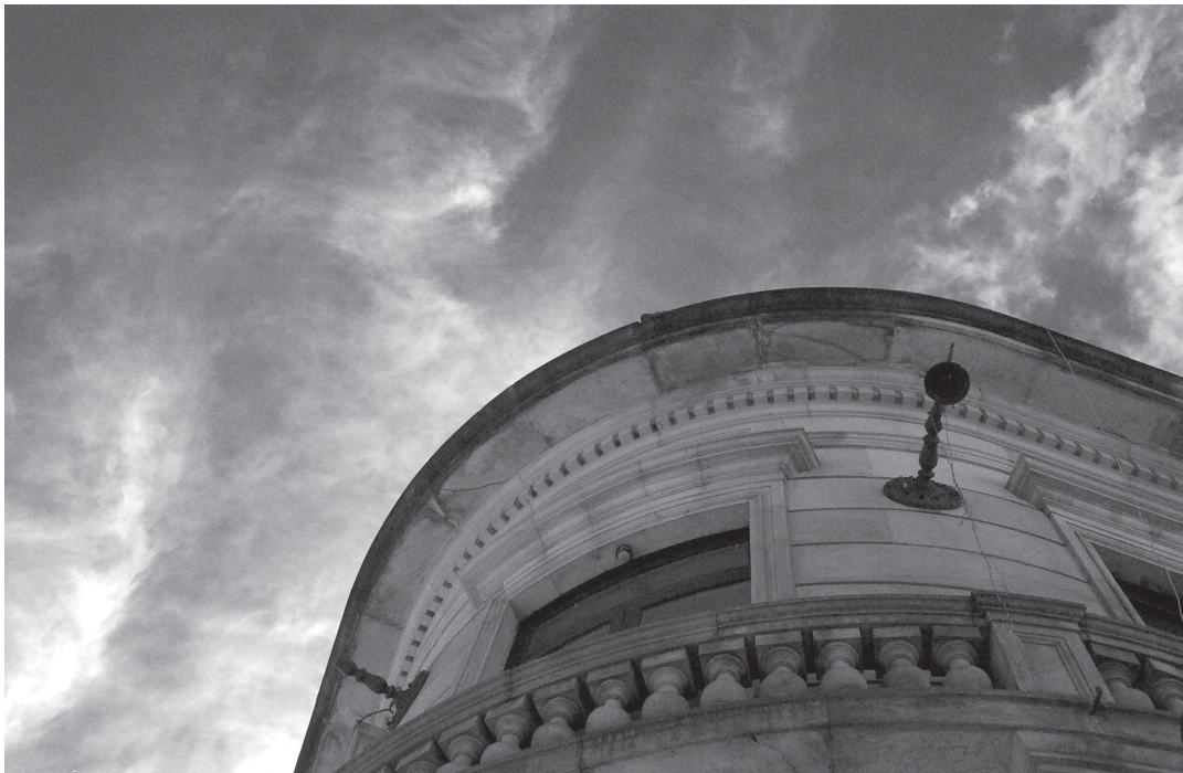
ARQUITECTURA, 2004