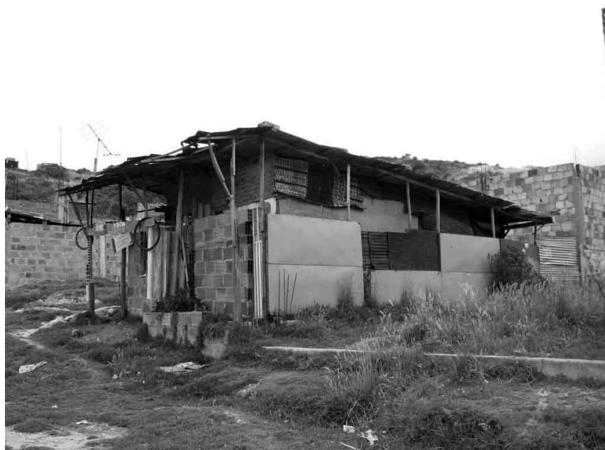
Imagen No. 8 Materiales

En cuanto al uso de materiales por espacio, este tiene que ver con los grados de consolidación; en la primera fase, el paroi , la lámina metálica y/o madera conforman el espacio multifuncional; el baño y la cocina pueden estar contruidos con los mismos materiales, bien sea que conformen un solo espacio con el área múltiple o separados de ella. Hay correspondencia en los materiales de piso con los de los muros, por ejemplo en las construcciones levantadas en paroi y lámina, generalmente los pisos son en tierra, cuando la edificación es en madera los pisos pueden pasar de la tierra a la madera y cuando las construcciones son prefabricadas o en mampostería, los pisos son la superficie de la placa de contrapiso