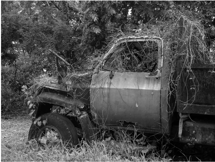
SAN ANDRÉS, 2006