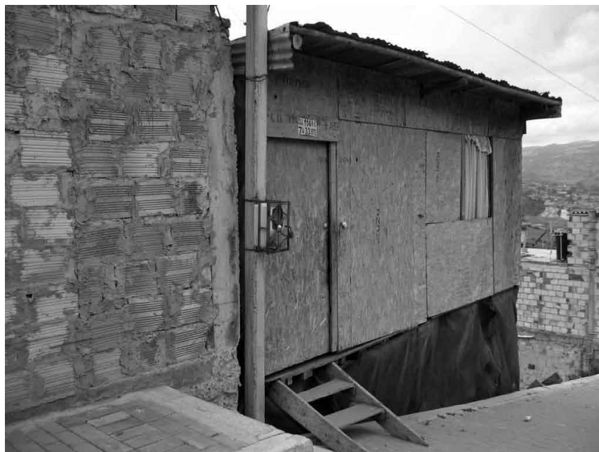
Imagen No. 10 Lo necesario en la vivienda

La gestión en esta etapa continúa con el pago del predio, la consecución de los materiales que en muchas ocasiones son de reuso o con imperfectos y la financiación del suministro de servicios públicos y de la infraestructura urbana. Su construcción generalmente tiene mínimas especificaciones técnicas con la adecuación de materiales varios. Corresponde a esta clasificación, las etapas de consolidación de construcción en madera o metal y la construcción en prefabricado.