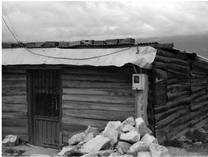
Imagen No. 6 Vivienda en madera