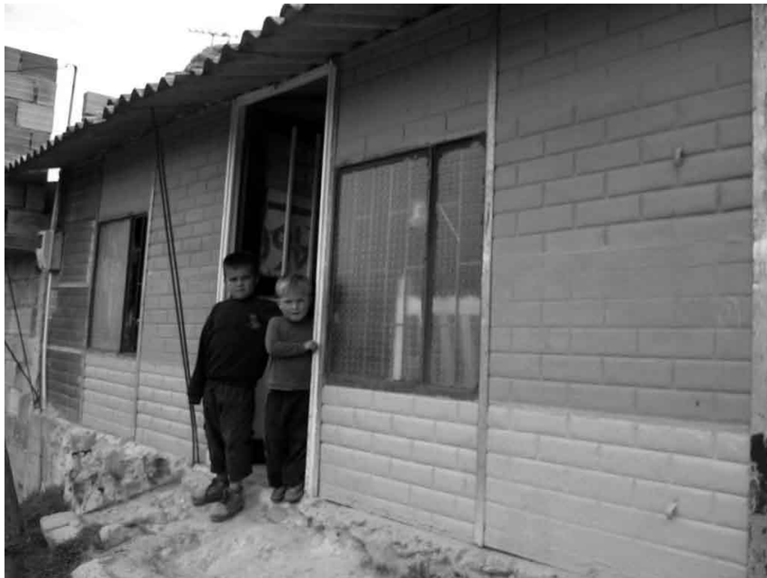
Imagen No.7 Vivienda en prefabricado