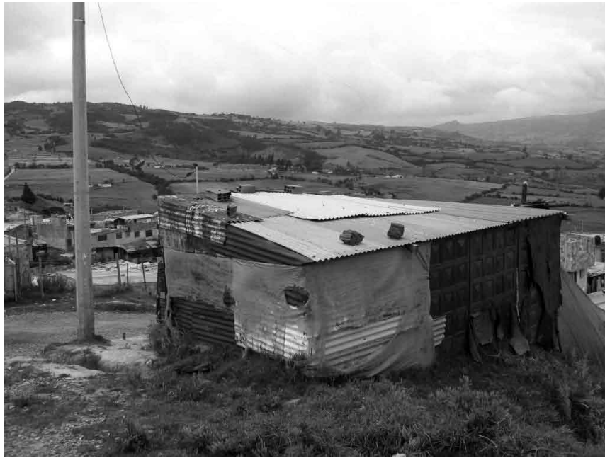
Imagen No.9 Lo indispensable en la vivienda

En respuesta a lo indispensable, los espacios que se generan son los de primera necesidad como un dormitorio y una zona de alimentos. La zona de servicio de aseo se adapta a un punto de suministro de agua, que es la misma para el lavado de ropa y el baño es provisional con un tendido de desagües comunales incipientes (Imagen No 9). La gestión en esta etapa se limita a demarcar el lote; el acceso a los servicios domiciliarios de agua y energía; la consecución de materiales y cancelar el valor del lote. Los elementos más utilizados son material de deshecho, plástico, latón, postes de madera, tabla ordinaria y alambres. Corresponde a esta clasificación la etapa de consolidación en paroi .