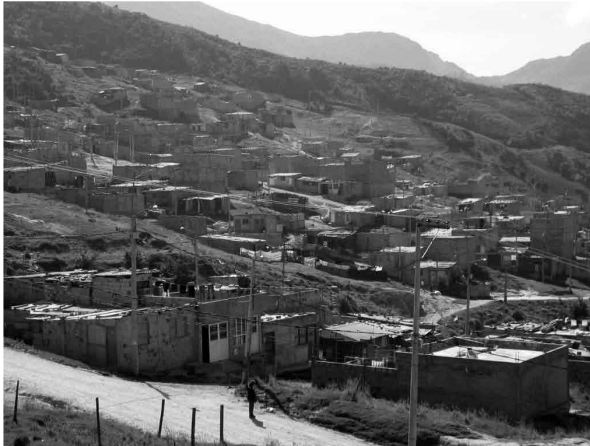
Imagen No.2 Contexto geográfico y perfil del barrio

El Sector II del barrio Puerta al Llano tiene un perfil homogéneo y casi lineal, la mayoría de las edificaciones son de un piso cubiertas con teja de zinc en pendientes mínimas, por ello se presenta una silueta constructiva quebrada por las curvas del terreno y adosada a la montaña.