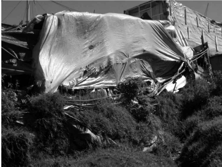
Imagen No.4 Vivienda en paroi

Se presenta una tercera etapa de consolidación cuando los espacios se conforman por prefabricados de concreto. Los techos continúan siendo construidos en zinc y el piso pasa de la tierra a la superficie de la placa de contrapiso. La construcción sigue siendo la minga o la contratación de un vecino o conocido al que no siempre se le cancela con dinero pues también puede hacerse por contraprestación. La accesibilidad a los servicios continúa siendo la misma. Se presenta una división espacial clara y la cocina puede estar dentro de lo conformado por el prefabricado, el baño permanece separado, construido en material de deshecho, al igual que la cocina cuando esta afuera del cerramiento prefabricado.