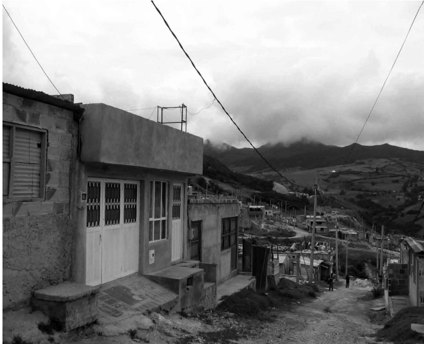
Imagen No.3 Adecuación del terreno

lote de terreno a la construcción como lo muestra la imagen No. 3; si el terreno es plano hay menos inconvenientes para construir, si el terreno es inclinado, se nivela en la mayoría de las veces por la parte más baja, es decir se excava equilibrando la línea de pendiente con la adecuación en rellenos de piedra o recebo.