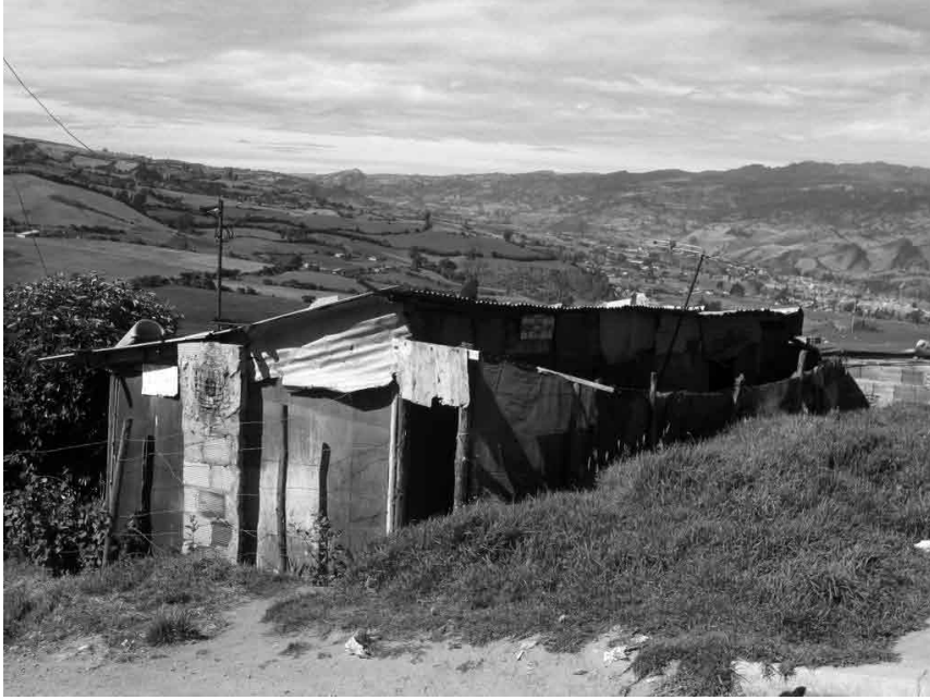
Imagen No. 5 Vivienda en metal