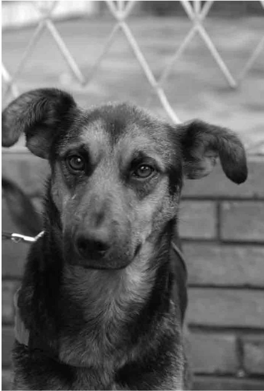
LUPE, PERRITA ABANDONADA, 2008