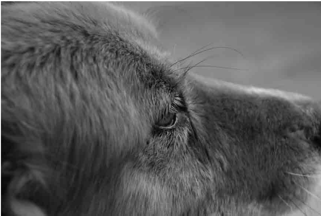
DANGER, PERRO CALLEJERO, 2008