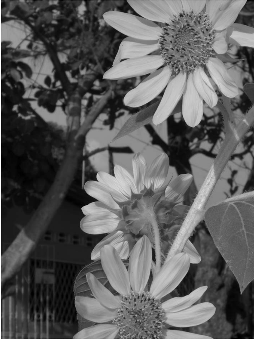
SIN TÍTULO Fotografía de Laura Chaves