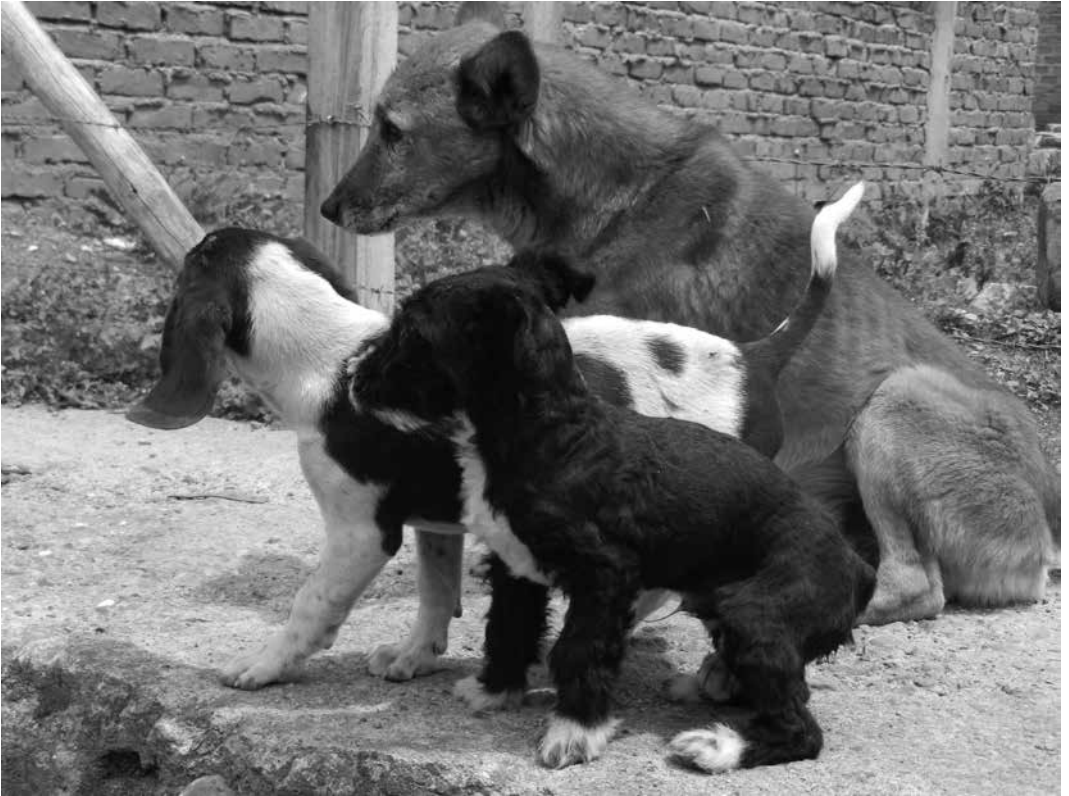
Perritos callejeros, Pitayó Leonardo Montenegro