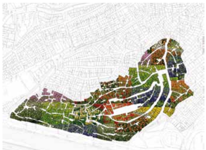
Figuras 4 y 5. Evolución del Morro de Basuras: infravivienda - montaña de flores.