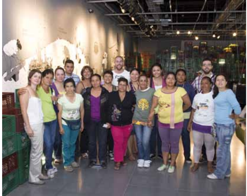
Figuras 14 y 15. Capacitación del Grupo de Jardines de Moravia.

dines de Moravia ha recibido capacitación en diversos ámbitos, formando a sus miembros de manera transversal entorno a la jardinería, el paisajismo y el medio ambiente, alternando sesiones teóricas y prácticas.