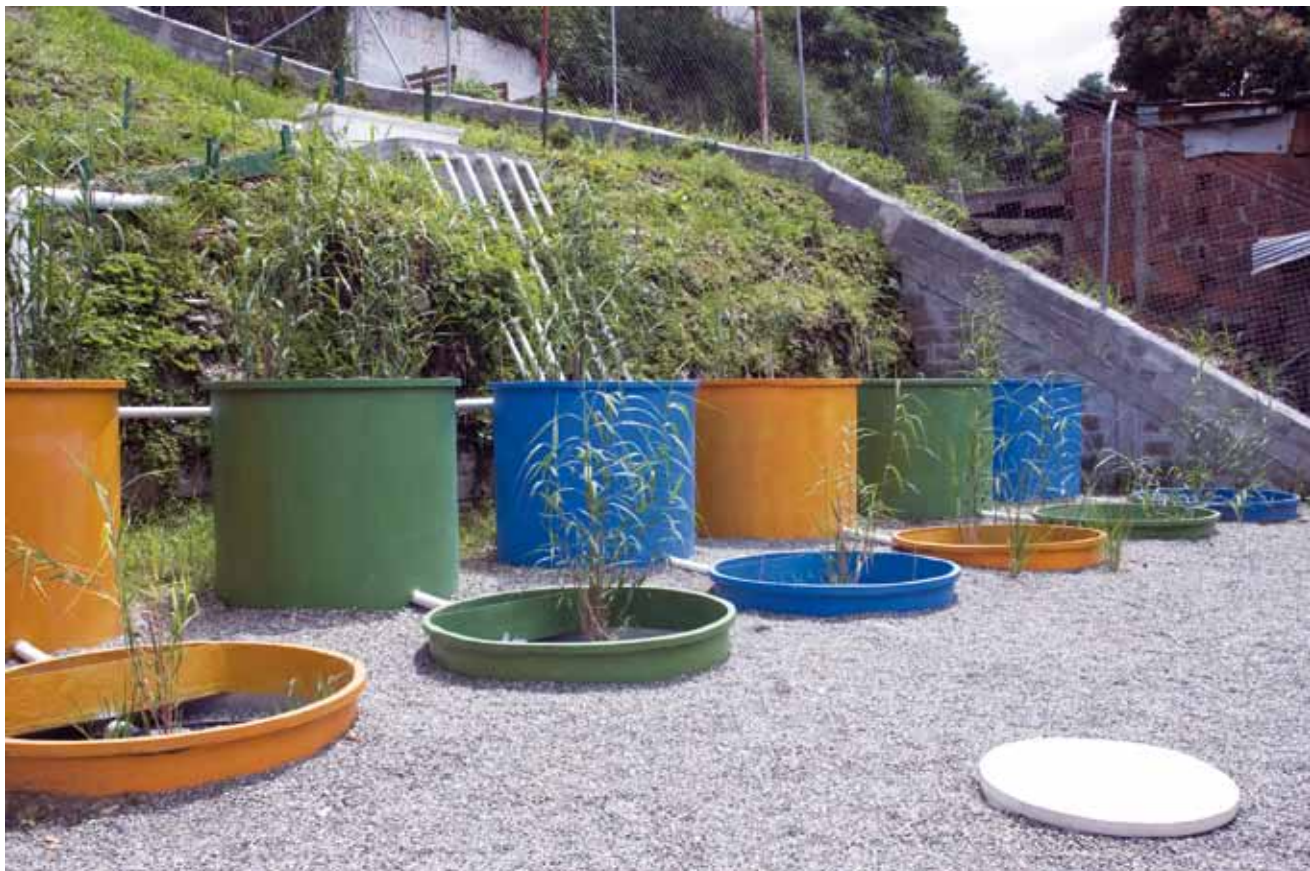
Figura 9. Ejecución planta piloto para el tratamiento de lixiviados.