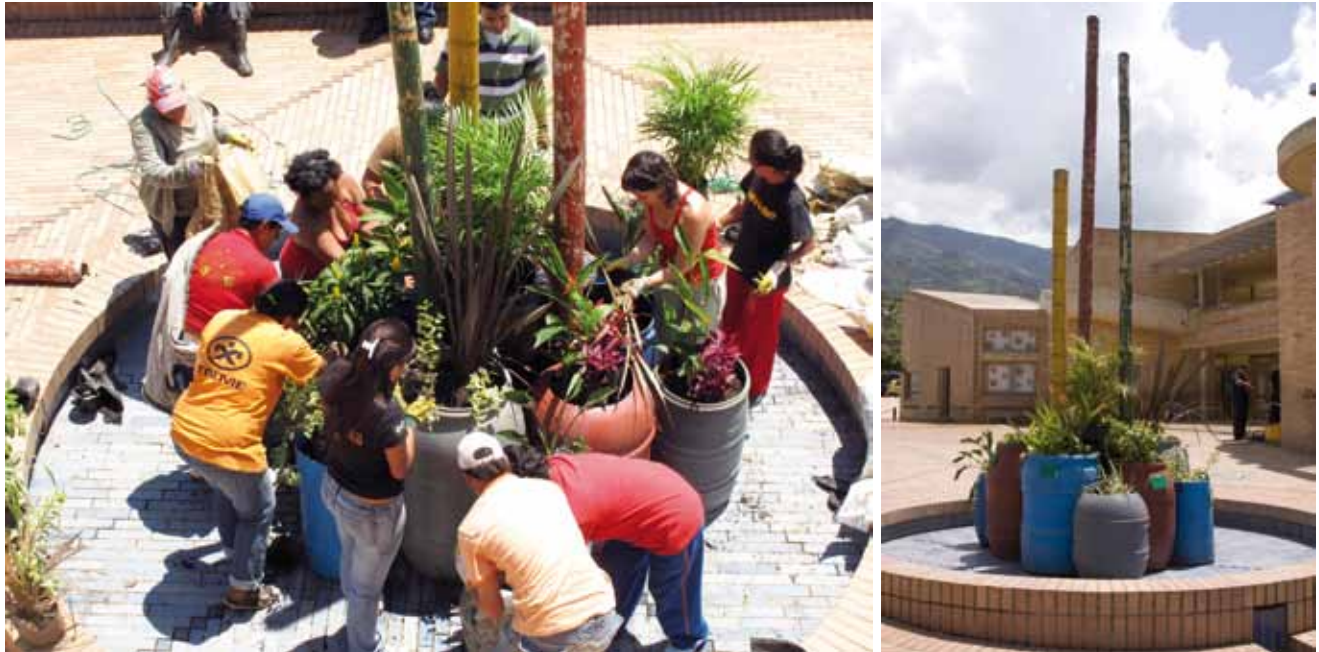
Figuras 10 y 11. Ejecución del primer Jardín Identitario, Moravia - Medellín.