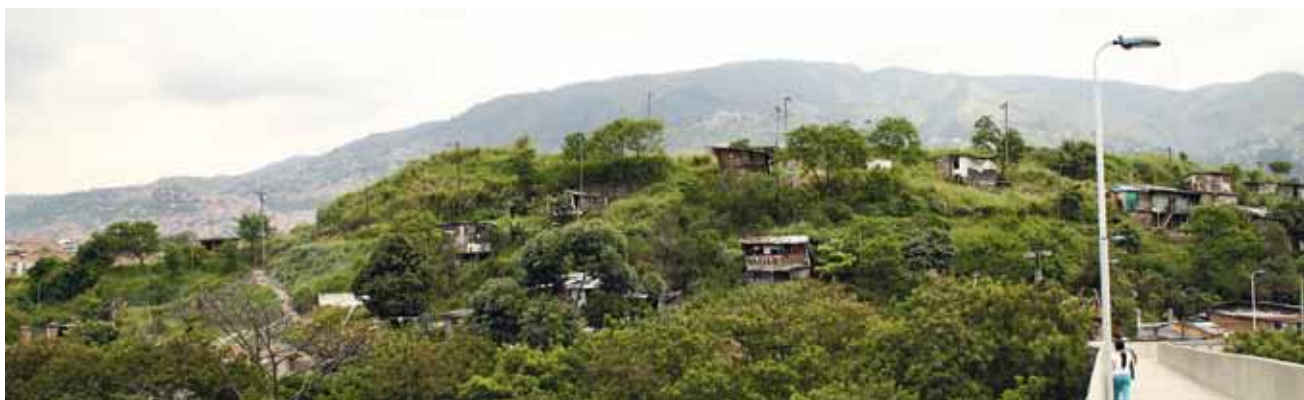
Figuras 2 y 3. Comparación del frente del Morro de basuras, año 2004 – año 2011. A. desconocido / ©2011 Daniel Viadé.