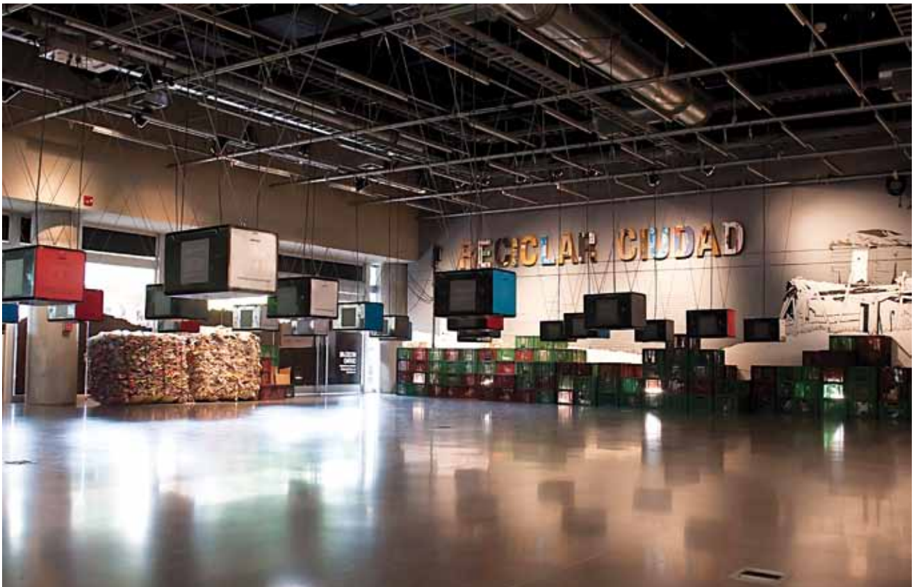
Figuras 16 y 17. Exposición “RECICLAR CIUDAD. Moravia, un proceso de transformación en Medellín”.