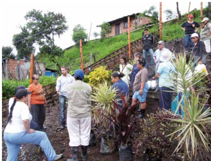
Figuras 12 y 13. Ejecución del primer jardín comunitario, Moravia – Medellín.

objetivos y actividades de acuerdo con la apreciación de los beneficiarios.