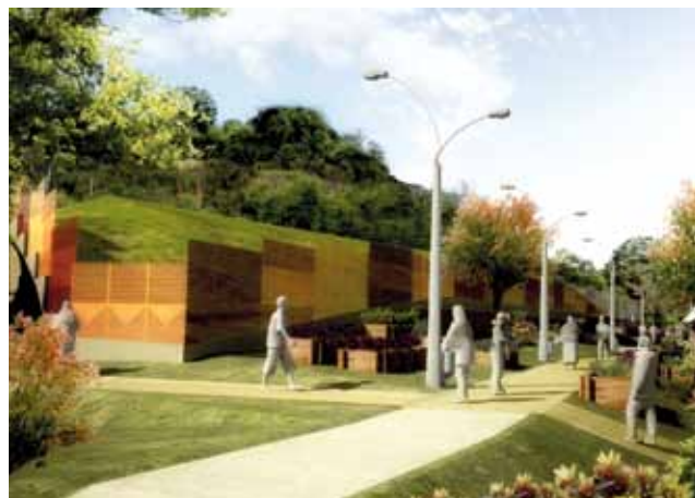
Figuras 6 y 7. Vistas generales del proyecto del Área Metropolitana del Valle de Aburrá para el parque lineal del Morro de Moravia.

la sustentabilidad del nuevo espacio, generado mediante la vinculación y participación directa de la comunidad, el uso de tecnologías apropiadas de bajo impacto ambiental para la gestión de agua que promuevan beneficios a nivel social y la potenciación de los servicios medioambientales asociados al territorio gestionado.