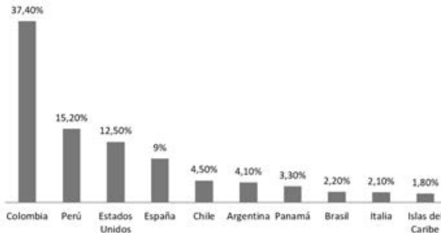
Gráfico 1. Principales destinos de los migrantes venezolanos al 2018