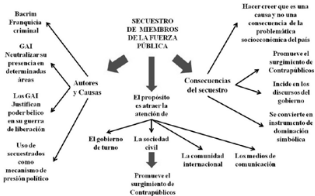
Figura 2. Registro de los medios del secuestro de miembros de la Fuerza Pública por GAI.